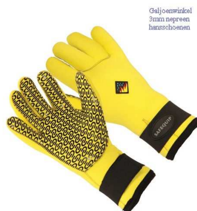
Galjoenwinkel 3mm neopreen handschoenen