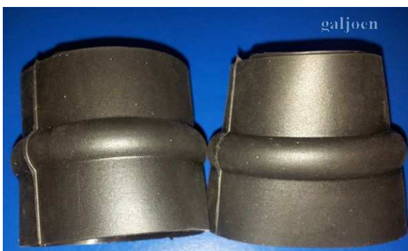
Voor de smalle pols, rubber ring