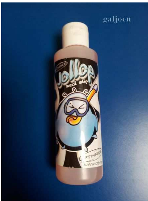
Glijmiddel voor neopreen pols- en nek seals Art.40010113