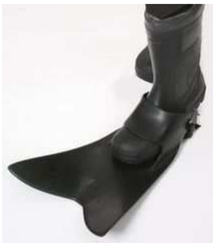
Foto: Force Fin Pro Ideaal bij oppervlakte reddingen

Andere producten ter aanvulling die apart besteld kunnen worden zijn: Voor de veiligheidslaars heeft Galjoen een speciale zwemflipper uitgezocht.