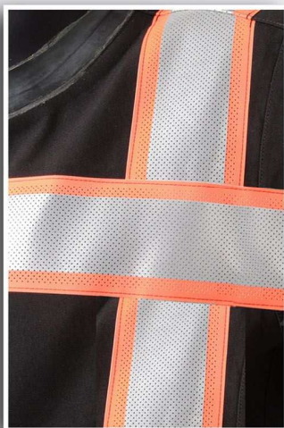
78 mm reflectie