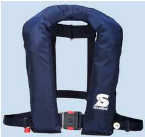
Secumar Golf 275 HV

Een optie is de Secumar Golf 275 HV en is ook in ALU uitvoering , Golf 275HV kan gebruikt worden aan de waterkant als automatisch en op het waadpak kan men het redvest aanpassen naar handbediend middels een automaatblokkering. De Golf 275 HV is speciaal ontwikkeld voor dragers van een brandweerhelm.