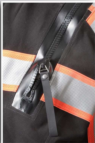
soepele YKK rits