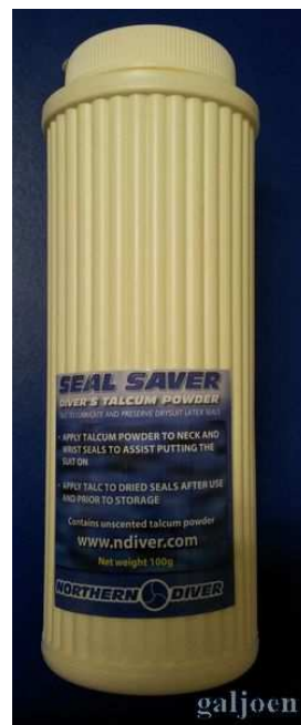
Bus talkpoeder Art. 40010114