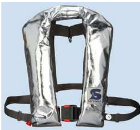
Secumar Golf 275 HV ALU