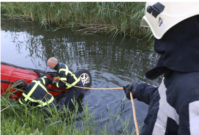
Controleren van de auto op personen

Enkele foto's van de oefenavond van de brandweer Harenkarspel post Dirkshorn van de Regio Noord-Holland Noord van woensdag 28 juni 2006.