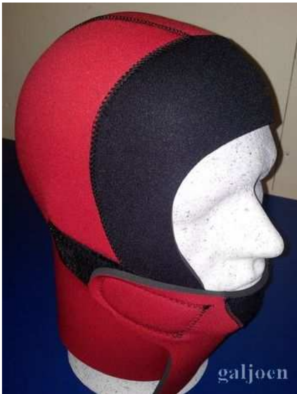
Neopreen hoofdkap met voorsluiting